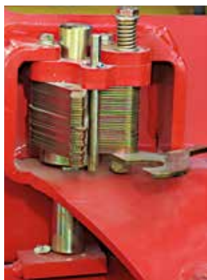
La profondità di semina è regolata tramite spessometri che limitano la distanza tra il telaio ed il supporto ruote.

Un sensore elettronico regolabile permette all'operatore di tarare la riserva del seme a seconda del prodotto e del suo volume.