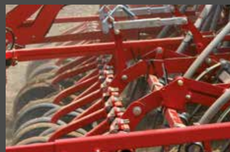
Un parallelogramma collegato all'erpice livellatore ed alle ruote limitatrici di profondità assicura una deposizione del seme tra le più accurate del mercato. Le particolari ruote posteriori garantiscono una profondità del seme perfetta anche in terreni bagnati e difforni.