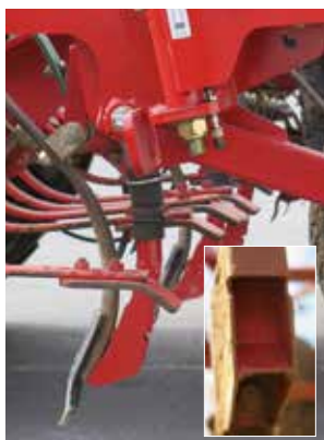
Un nuovo e brevettato sistema di deposizione del seme consente un' emergenza costante anche in terreni irregolari.