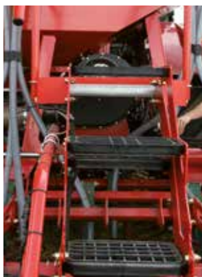
La nuova scaletta con ringhiera garantisce facile accesso al serbatoio in grande sicurezza.