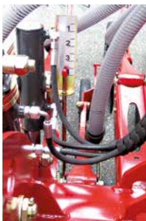
L'operatore potrà controllare direttamente dalla cabina la regolazione impostata lateralmente.