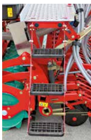
Facile e sicuro accesso con la nuova pedana.