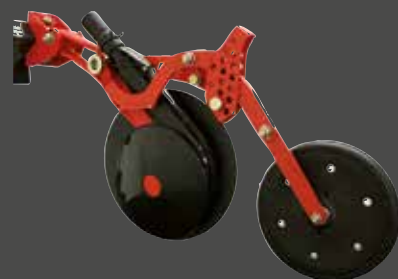
Falcione a doppio disco CX II : semina precisa e costante fino a 6 cm di profondità.