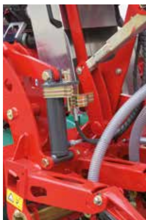
La regolazione della profondità con spessometri è posizionata sui due cilindri laterali.

La e-drill maxi ha una capacità della tramoggia di 2000 lt. Il particolare coperchio con protezione antiturto assicura l'operatore durante il carico con Big Bag. Un sensore elettronico di livello seme regolabile dall'esterno permette di tarare la riserva in base al prodotto da seminare.