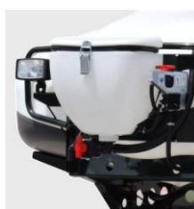
Mixer da 35 lt.