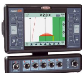
Computer Bravo 180s o 400s