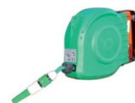
Kit lavaggio esterno