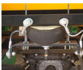
Elevazione con sospensione ad aria