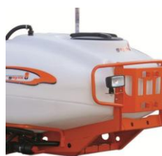
Kit luci anteriori e posteriori