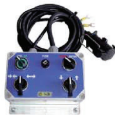
Comandi elettici in cabina