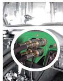
Diretto alle uscite del trattore